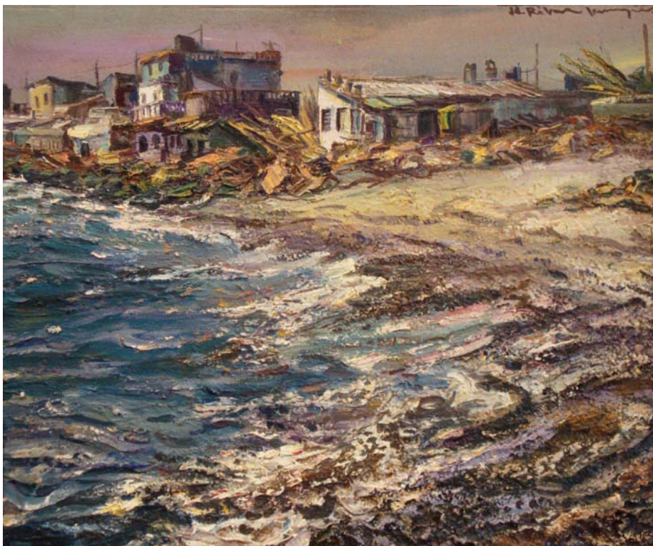
Lote nº 130: J. RIBERA BERENGUER. "Pinedo". Oleo/Lienzo. 46 x 55 cms.