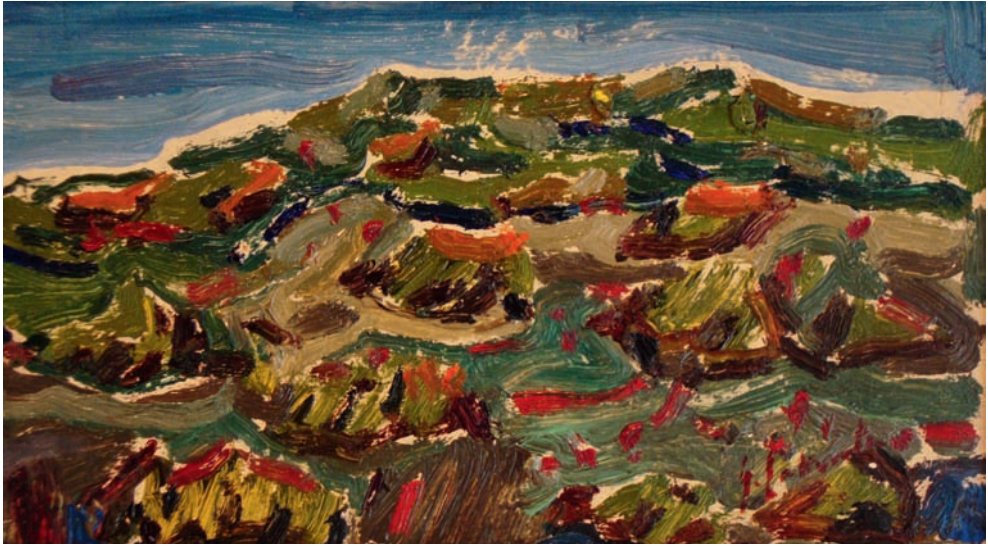
Lote n° 117: GENARO LAHUERTA. "Paisaje" . Oleo/Tabla. 14 x 24 cms.