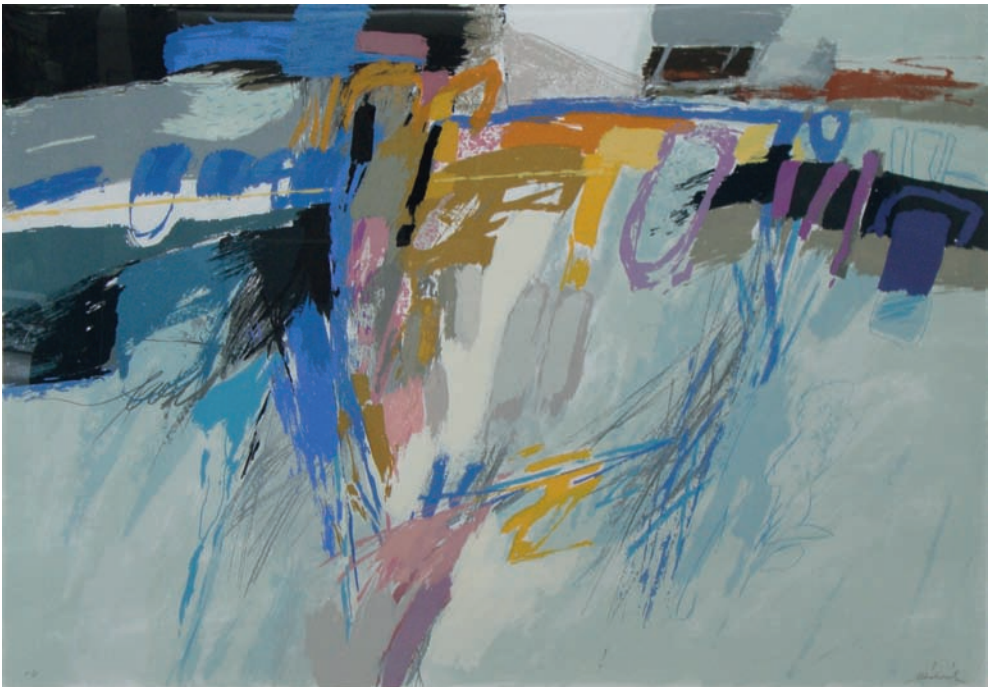
Lote n° 112: J. MICHAVILA. "Llac" . Serigrafía P.A. 62 x 89 cms.