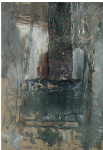
Lote nº 95: J. SANLEÓN. "Abstracto". Técnica mixta/Cartón. 100 x 71 cms.