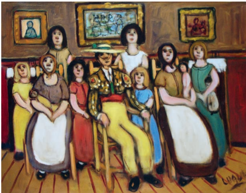
Lote n° 67: MANUEL LUQUE. "Familia torero". Oleo/Lienzo. 73 x 92 cms.