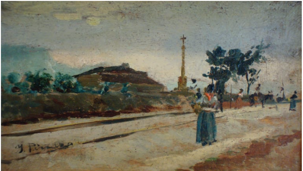
Lote nº 110: IGNACIO PINAZO. "Godella". Oleo/Tabla. 10 x 17 cms.