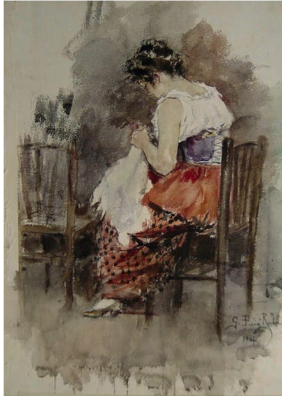
Lote nº 119: G. PUIG RODA. "Zurcidora". Acuarela. 58 x 40 cms.