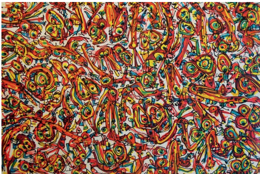
Lote nº 128: ANTONIO SAURA. "Cocktail Party". Litografía 35/125. 59 x 87 cms.