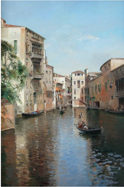
Lote n° 55: J. L. CHECA. "Venecia". Oleo/Lienzo. 55 x 38 cms.