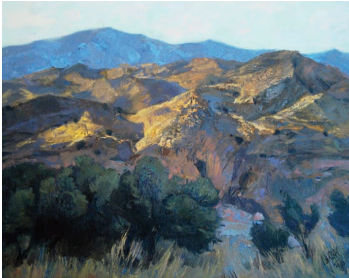
Lote nº 124: LUIS ARCAS. "Paisaje". Oleo/Lienzo. 50 x 61 cms.