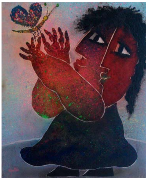
Lote nº 114: J. RIPOLLES. "Cazando la mariposa". Técnica mixta/Lienzo. 73 x 60 cms.