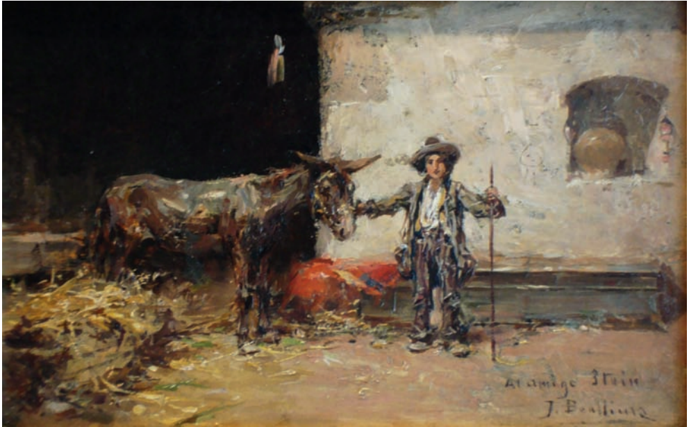
Lote nº 125: JOSÉ BENLLIURE. "Niño con burro". Oleo/Tabla. 13 x 20 cms.