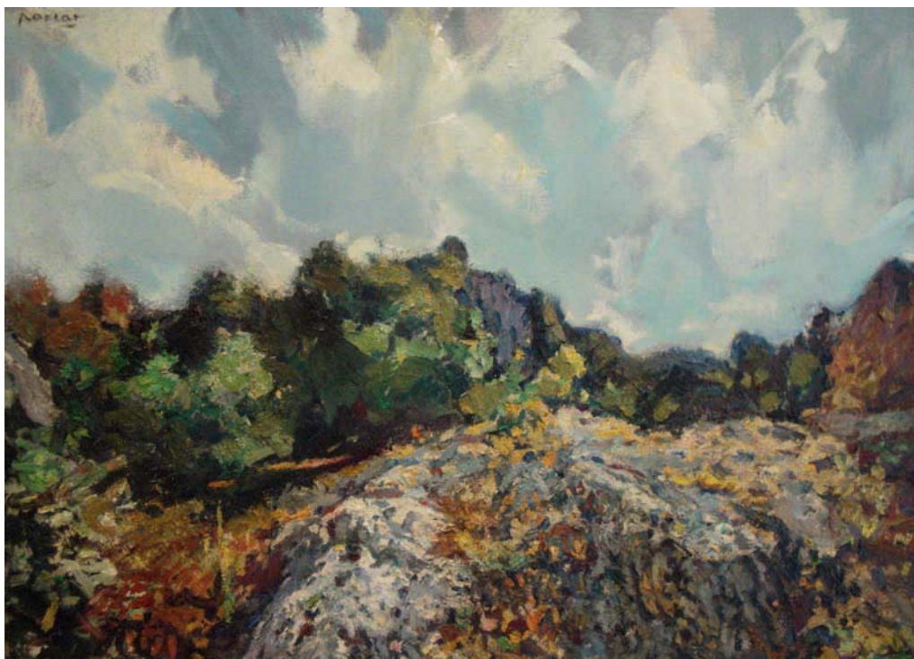
Lote nº 127: JUAN BTA. PORCAR. "Paisaje". Oleo/Lienzo. 73 x 100 cms.

SÁBADO, DÍA 19 DE DICIEMBRE DE 2009 A LAS 7 DE LA TARDE