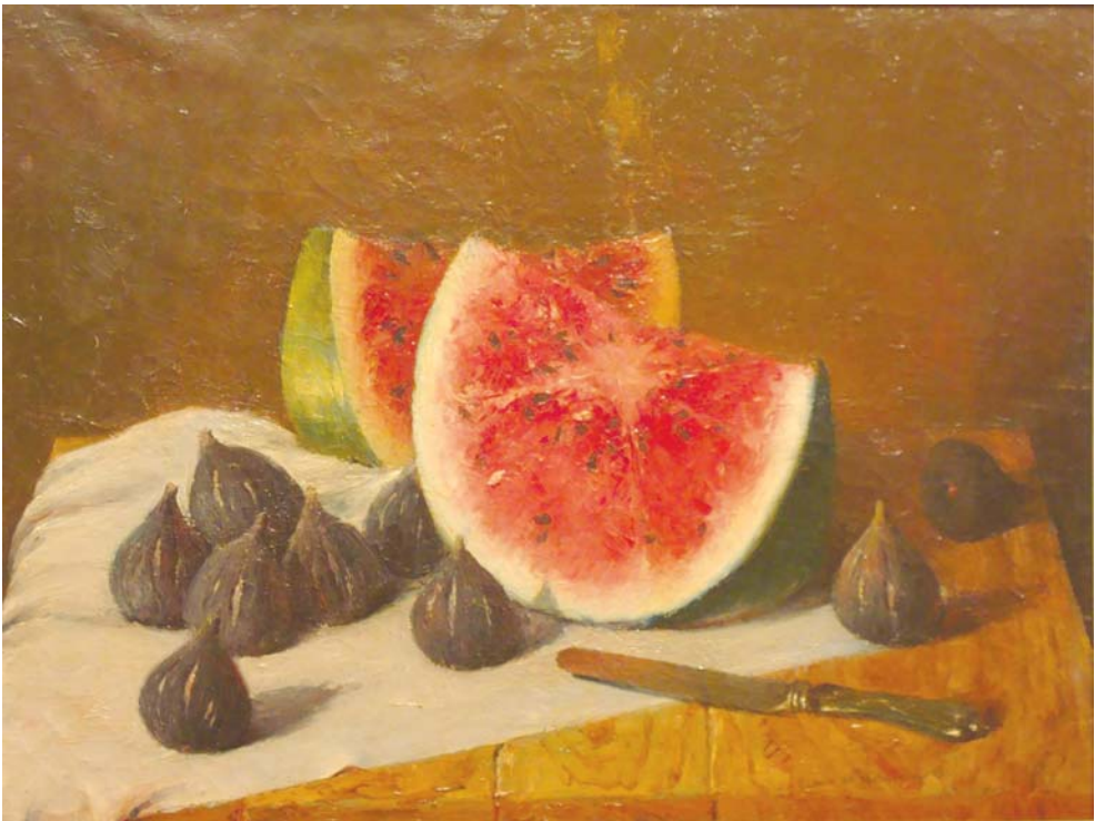
Lote n° 128: PEDRO DE VALENCIA. "Bodegón" Oleo/Lienzo 48 x 62 cm