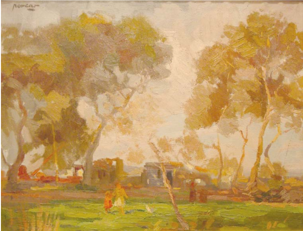
Lote nº 121: JUAN BTA. PORCAR. "Mañanita" Oleo/Lienzo 50 x 65 cm