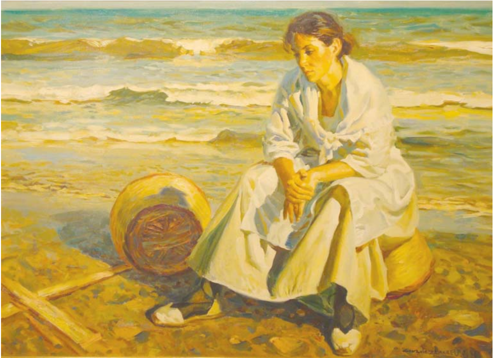
Lote nº 137: GONZALEZ ALACREU. "Pescadora" Oleo/Lienzo 73 x 100 cm