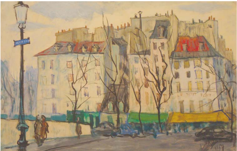
Lote n° 126: LUIS ARCAS. "Calles de París" Acuarela 31 x 50 cm