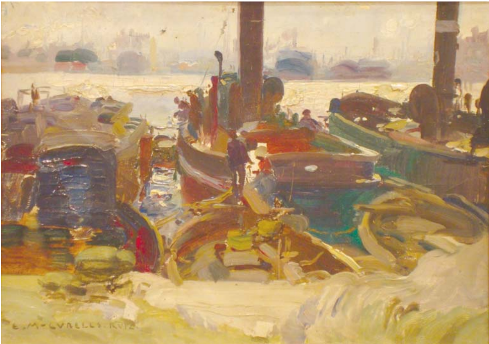
Lote nº 118: E. MARTINEZ CUBELLS. "Puerto" Oleo/Lienzo 14,5 x 20 cm