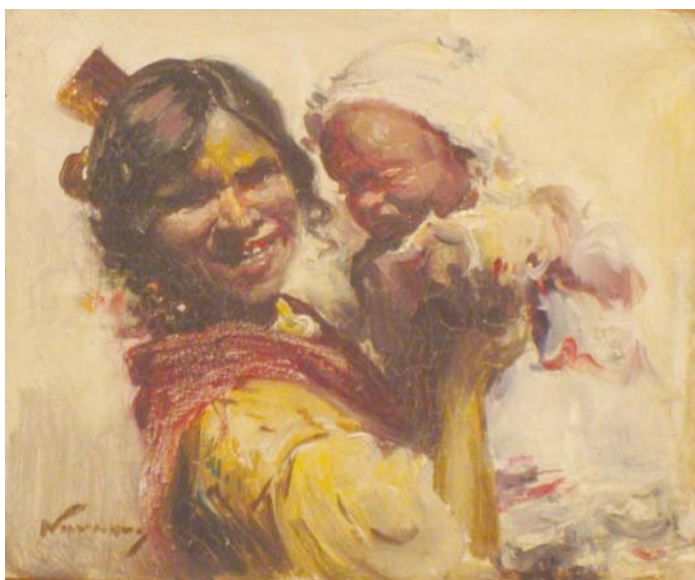
Lote nº 114: J. NAVARRO LLORENS. "Gitanilla con niño" Oleo/Tabla 9 x 11 cm