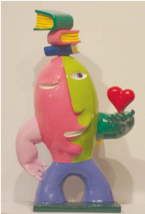
Lote nº 101 - J. RIPOLLES. "Pensador" Escultura/Resina