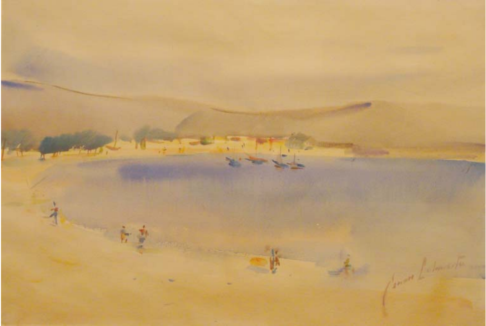
Lote n° 103: GENARO LAHUERTA. "Playa de Altea" Acuarela 36 x 50 cm