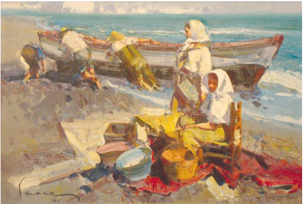
Lote nº 73: EUSTAQUIO SEGRELLES. "Sol de Levante" Oleo/Lienzo 38 x 55 cm