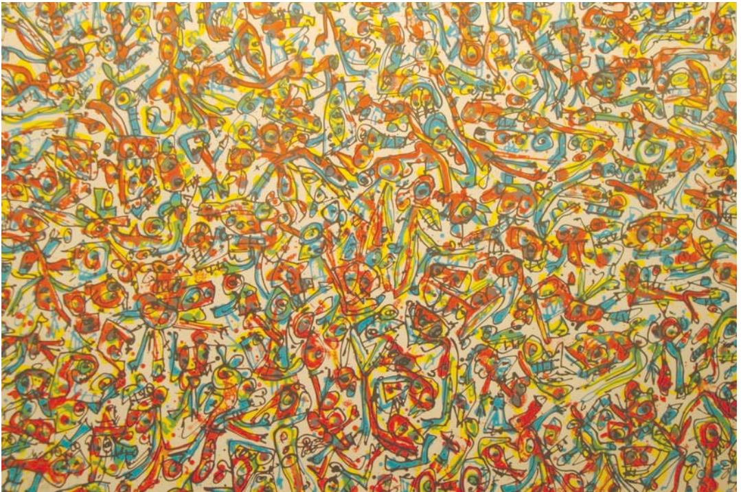
Lote nº 124 - ANTONIO SAURA. "Cocktail Party" Litografía 26/125