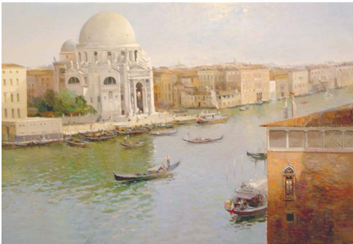
Lote nº 133: JOSE L. CHECA. "Canal de Venecia" Oleo/Lienzo 38 x 55 cm