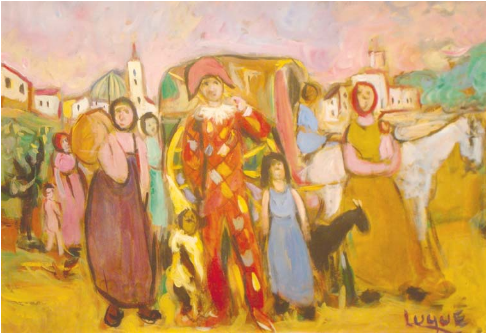
Lote n° 112: MANUEL LUQUE. "Titiriteros" Guaché 47 x 68 cm