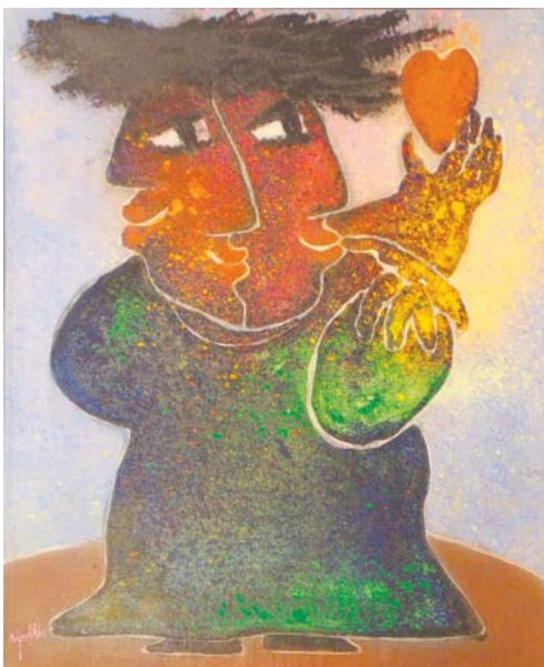
Lote nº 136: J. RIPOLLES. "Figura verde con corazón" Óleo/Lienzo. 61 x 50 cm