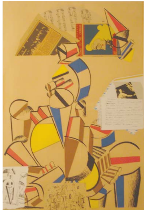
Lote nº 130 - M. VALDES. "Composición" Litografía 7/75