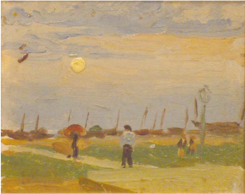
Lote nº 135: J. SOROLLA BASTIDA. "Playa de Valencia" Oleo/Cartón 6,7 x 8,5 cm