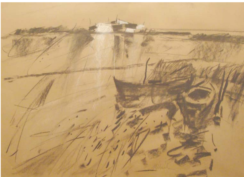
Lote nº 117: JOAQUIN MICHAVILA. "Llac" Dibujo Carbón 53 x 72 cm