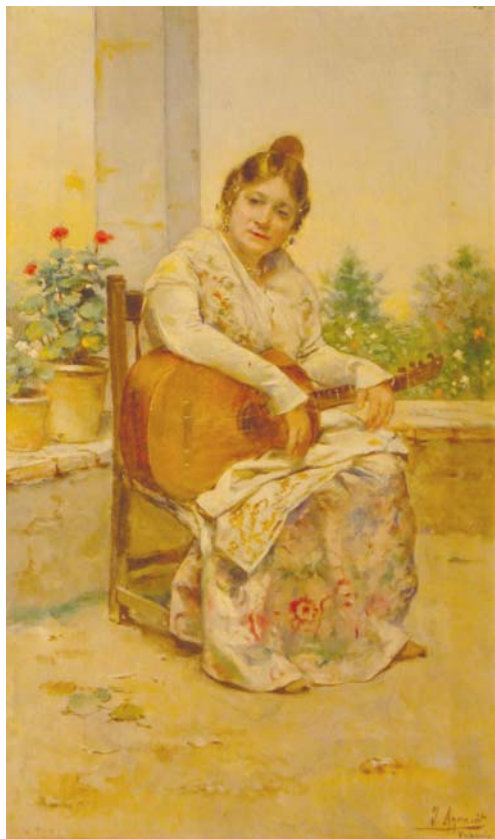
Lote nº 104: J. AGRASOT. "Valenciana con guitarra" Oleo/Lienzo 65 x 40 cm